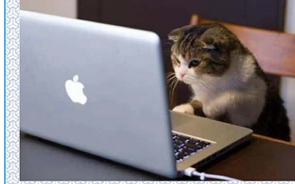
努力工作!